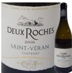
白ワイン フランス ブルゴーニュ シャルドネ100% 1本 6,050円

完璧に収穫されたシャルドネの最も美味しい状態のまま、すぐさま搾り、最高のブドウエキスだけを抽出して、最高の状態で醸造された、まさに常識を覆すかのような【モンスター・シャブリ】です。