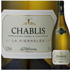
白ワイン フランス ブルゴーニュ シャルドネ100% 1本 7,150円